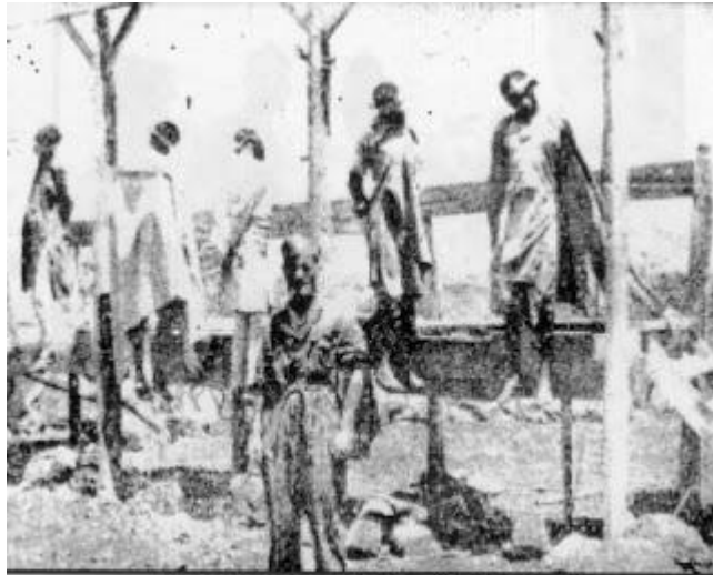
A hangman proud of his work; the massacre of village dignitaries.

ፋሽስቶችም የተማረከውን ህዝብ እንደ ከብት በመገድ አስረው ከዓመፀኛ ዋሻ