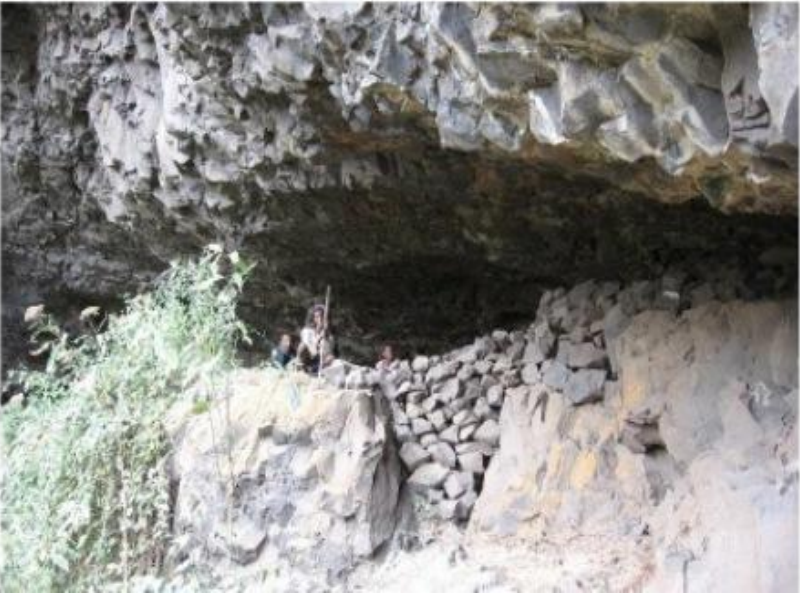
ርቀት ለመሸፈን ከግማሽ ሰአት በላይ ይፈጃል። (ፎቶ፣ ዓመፀኛ ዋሻ መግቢያ)

ዓመፀኛ ዋሻ በመንዝ ጌራ ምድር አውራጃ ልዩ ስሙ ዘረት በሚባል ስፍራ ይገኛል። ወደ ዓመፀኛ ዋሻ የሚደረገው ጉዞም ብርቱ ጥንቃቄን ይጠይቃል። እልም ያለው ገደል አስፈሪ ከመሆኑም በላይ መንገዱም ጠመዝማዛና ረዥም በመሆኑ ከገደሉ አፋፍ እስከ መግቢያው ጫፍ ያለውን አጭር