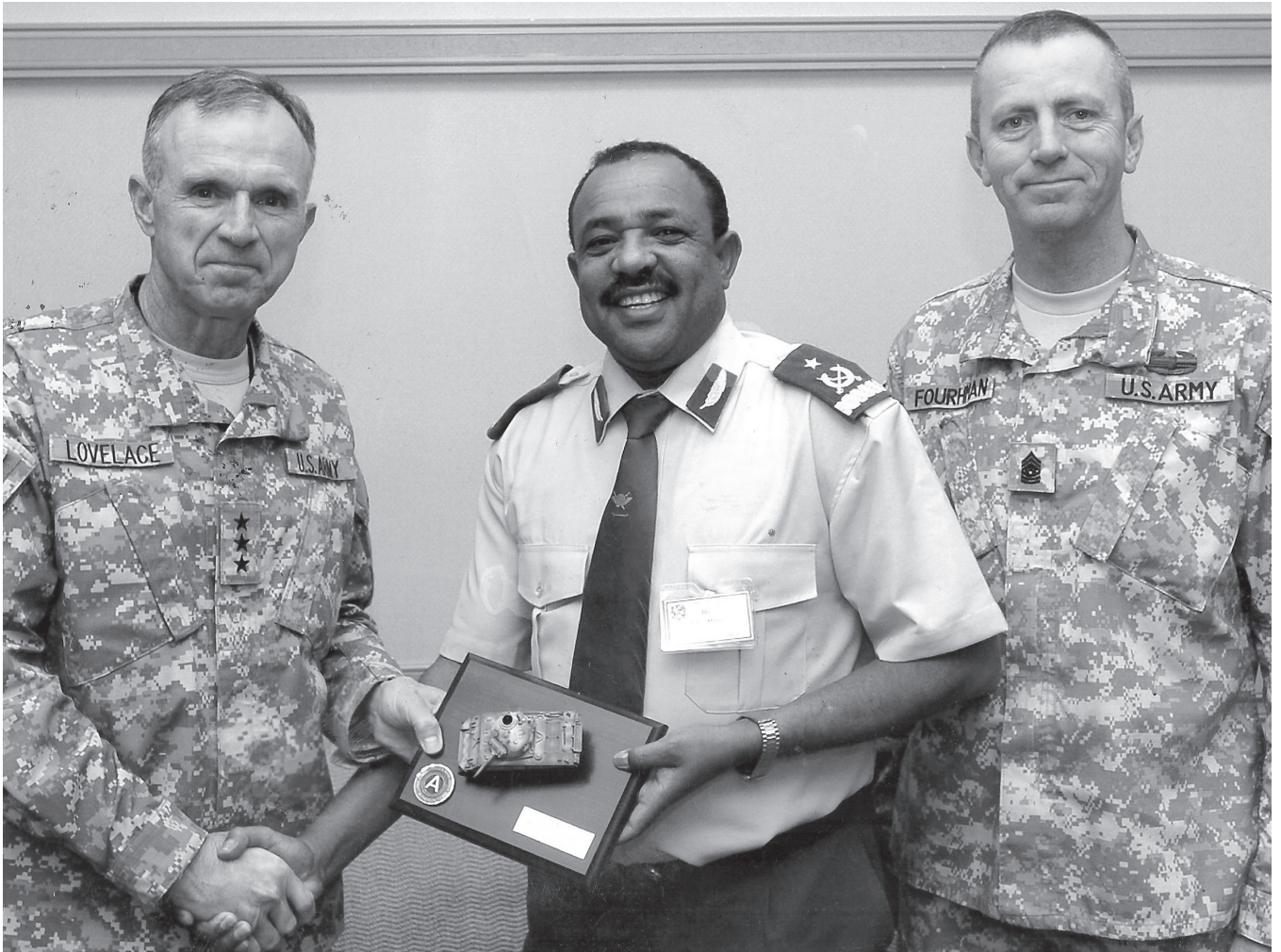
ከአሜሪካን ኢታሚጅር ሹም ሽልማት የተቀበሉበት 2001 ዓ.ም

ብርጋዲየር ጄነራል ተፈራማዋ በትግሉ ወቅት ስለ ነበሩ አንዳንድ ችግሮች፣ከተለያዩ የብሔራዊና የሕወሓት አመራሮች ጋር ተከስቶ የነበረውን አለመግባባትና ሌሎች ተዛማጅ ጉዳዮችን በተመለከተ ያደረጉትን የመጨረሻ ቃለ ምልልስ ፍቃዱ ማህተመወርቅ እንደሚከተለው አቅርቦታል።