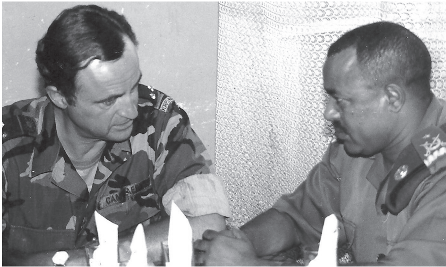
የኢትዮ-ኤርትራ የሠላም አዛዥ በባድመ ውጊያ ዙሪያ ውይይት ሲያደርጉ

የመቀራረብና የመግባባት ስሜት ደስ ይልሃል። አንዲት ማዳበሪያ ሲሰርቅ ቢገኝ ወዲያው በግምገማ ያፋጥጡታል። ሕዝቡ እንደ ሕዝብ ንፁሕ እና እንግዳ ወዳጅ የእግዚአብሔር ሕዝብ ነው። በሩቁ ሆነው ስም እንደሚያውጡለት አይደለም። ኢትዮጵያ ስሜቱ የጋለ ነው። ለምሳሌ ሻዕቢያ ወደ ውስጥ ገብቶ ፈንጂ እንዳይጥል አደጋ እንዳይፈጥር፤ ሕዝቡ እያንዳንዳን እዚያ አቅጣጫ የሚመጣ ዕቃ ይቆጣጠር ነበር።