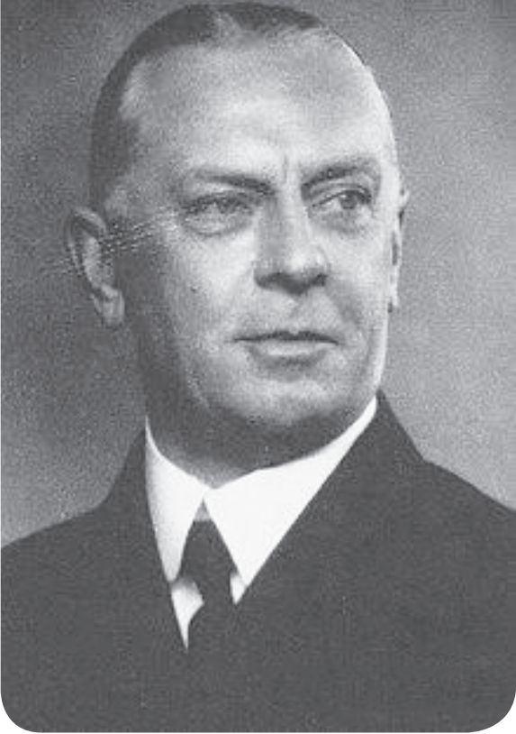
ሜጀር ጄነራል ኤሪክ ቨርጂን

ዛ ሬ 83 ዓመት በፊት ቀዳማዊ ኃይለሥላሴ የኢትዮጵያን የመንግሥት አስተዳደር በዘመናዊ መልክ ለማደራጀት በማሰብ በተለያዩ የሙያ ዘርፎች ተሰማርተው የሚያገለግሉ በርካታ የውጭ ዜጎችን ቀጥረው ነበር።