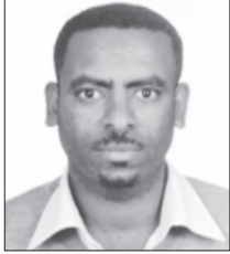
ተስፋ (ኢትዮጵያ) አልታሰብ