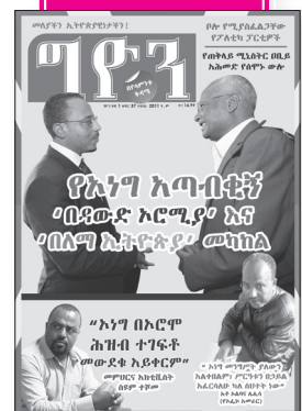
ቁጥር 37 ዕትም