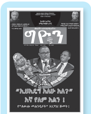
ቁጥር 52 ዕትም