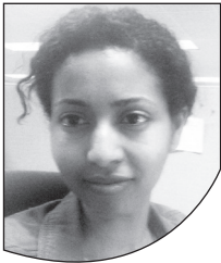
ከናፍቆት ገለው አጫሪካ