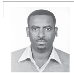
ተስፋ (ኢትዮጵያ) አልታሰብ

በቅርብ ዓመታት ውስጥ ያስተዋልነው የኢትዮጵያ ዲሞክራሲ ሂደት ውስጥ ይህም የዲሞክራሲ ስምንት ሆኖ ለሁሉም ህዝብ ብቻውን መቆም አይችልም ህግና ርትክ ያስፈልገዋል። የዲሞክራሲ ልክና ልንም ሊበጅሉት ይገባል። የሰውጡ መንግስት አዲስ መንገድ ቀይሶ ለተበደሉ ዜጎች የፖለቲካና የመንግስት ነፃነት ምህዳር አስፍቶ መክፈቱ ሊመሰገን ይገባል። እስረኞች መፈታታቸውም፤ ፖለቲከኞች ወደ አገራቸው ገብተው እንዲታገሉ መደረጉም እስይ የሚያስብል መልካም ድርጊት ነው። ዛሬም በአገራችን በተለያዩ ፖለቲካዊም ይሁን ህጋዊ ምክንያት የታሰሩት ወንጀላዊነትን በእርቅ ከእስር ነፃ ሆነው በወጡ ሁላችንም የሚያስደስት፤ እንደ ሩዋንዳና ደቡብ አፍሪካ ህዝብ እርቅና ፍትህ አድርገን ሁላችን ለሀገራችን እንድንሰራ በደረግ አገር ተጠቃሚ ትሆናለች። የሰው ልጅ በመታሰር፤ በመሰደዱ ማንም ኢትዮጵያዊ ደስተኛ አይሆንም። ሰዎች ተሳስተው ህግ ተላልፈው ሊሆን ይችላል። የማይሰራ አይሳሳትም። የሚሰራ ሰው ሲሰራ ስህተት መስራቱ አይቀርም።