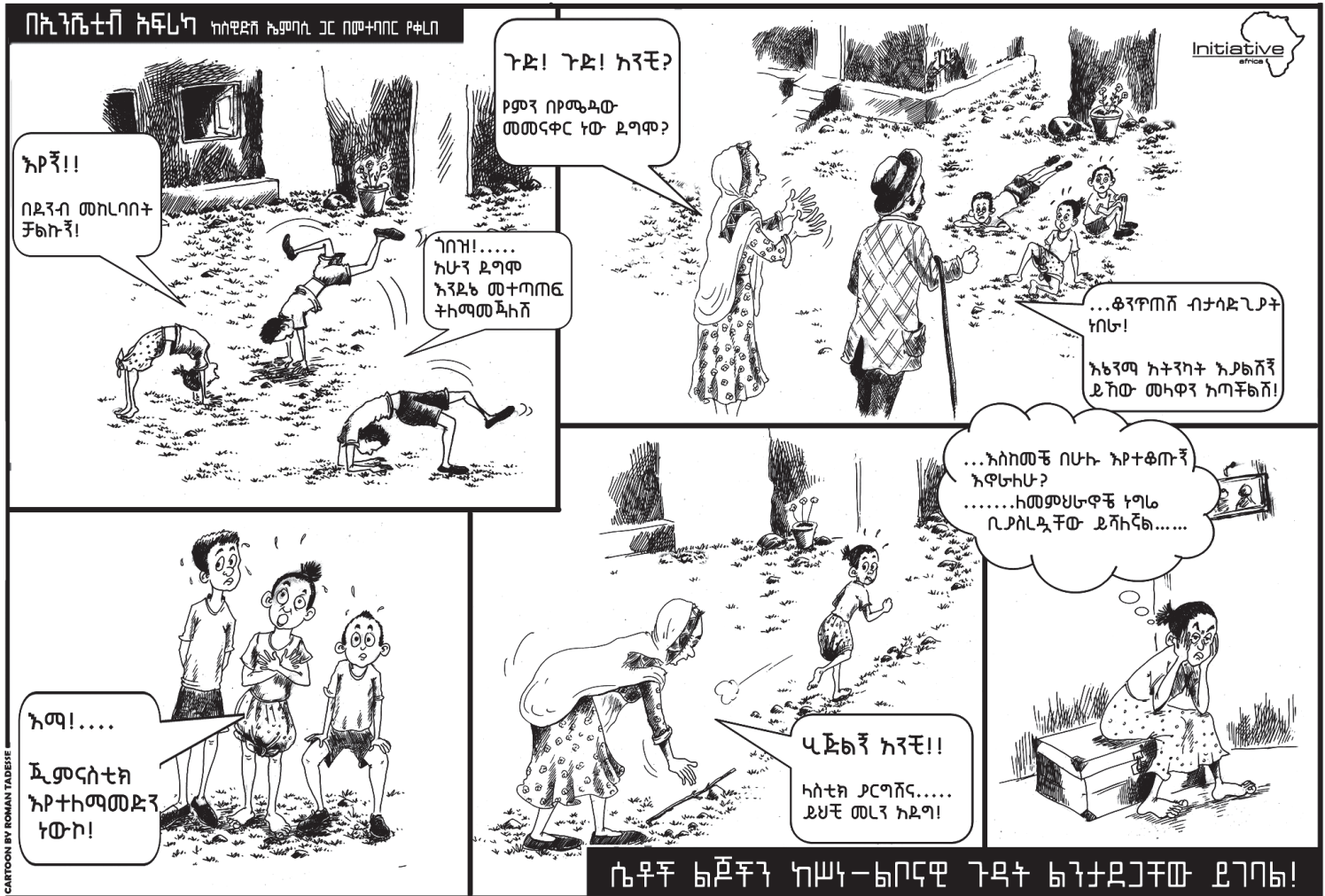
CARTOON BY ROMAN TADESSE