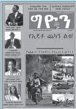
ቁጥር 66 ዕትም