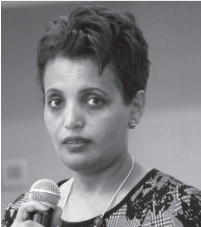
የብሄራዊ የምርጫ ቦርድ ፕሬዝዳንት ወ/ት ብርቱካን ሚዳቅሳ

የደክተር ዐብይ ኢህአዴግ ዲሞክራሲ አለ ብለው ሃሳባቸውን በነጻነት የገለጹ ፣ ነገር ግን የተፈቀደላቸውን መብት በመጠቀማቸው ሳቢያ እንደአጥፊ ተቆጥረው በየእስር ቤቱ የታጎሩ ዜጎችን ከፈታ በኋላ በውጭ ያሉ፣ ለኢትዮጵያ ህዝቦች ጥቅም ነፍጥ አንስተውም ይሁን በሃሳብ ተግተው የታገሉ የፖለቲካ ድርጅቶችን ወደሃገር ቤት ገብተው ትግላቸውን በሰላማዊ መንገድ እንዲያካሂዱ ጋብሟል። ይህም እጅግ ስኬታማ በሚባል ሁኔታ ሁሉንም (እንደአርበኞች ግንቦት ሰባት፣ አነጻጻ አብነግ ያሉ) በትጥቅ ትግል ጭምር የታገዘ የፖለቲካ እንቅስቃሴ ያደርጉ የነበሩትንና በሰላማዊ መንገድ የሚታገሉ ፓርቲዎችን ወደሃገር ውስጥ በማምጣት ተጠናቋል።