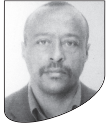
መታሰቢያ መልክስ ሕይወት