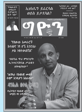
ቁጥር 68 ዕትም