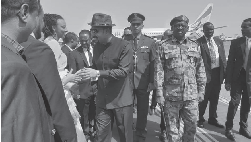
ጠ/ሚኒስትር አብይ ካርቱም ሲደርሱ የተደረገላቸው አቀባበል

ከፊርማው ሥነ ሥርዓት ጎንለጎን የቀድሞው የተባበሩት መንግሥታት የምጣኔ ሀብት ባለሙያ አብደላ ሀምደክ አዲሱ ጠቅላይ ሚኒስትር፣ የተቃዋሚ ድርጅት መሪው መሐመድ አልሃናዚ መሐመድ ዋና ዓቃቤ ሕግ (public prosecutor) እንዲሁም አብዱልቃድር ሙሐመድ የፍትህ ዘርፍ ዋና ተጠሪ ሊሆኑ እንደሚችሉ የተለያዩ መገናኛ ብዙሃን በመዘገብ ላይ ናቸው። የፊርማውን ሂደት ተከትሎ በአስር ሺህዎች የሚቆጠሩ ሱዳናውያን በካርቱም አደባባዮች በመውጣት ከአልበሽር መንግሥት መውደቅ በኋላ ለሁለተኛ ጊዜ የድጋፍ ሰልፍ አድርገዋል።