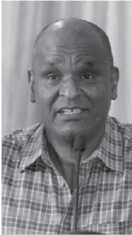
የተለወጡበትን ሂደት እንዴት አዩት?

ግዮን፡- የኢህአዴግ ሦስት ፓርቲዎችና በተለምዶ አጋር የሚሰኙት ፓርቲዎች በውህደት ብልፅግና ወደተሰኘው ፓርቲ